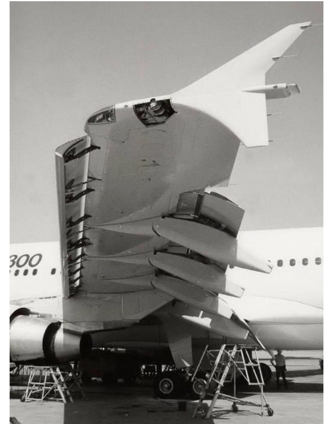
Dispositifs hypersustentateurs sur une aile

Afin de garantir un déploiement rapide de ces moteurs, il est primordial d'accélérer la création de leurs lois de commande. L'objectif du projet est de fournir une librairie de symboles fiables (briques fonctionnelles) utilisables dans ces lois de commande.