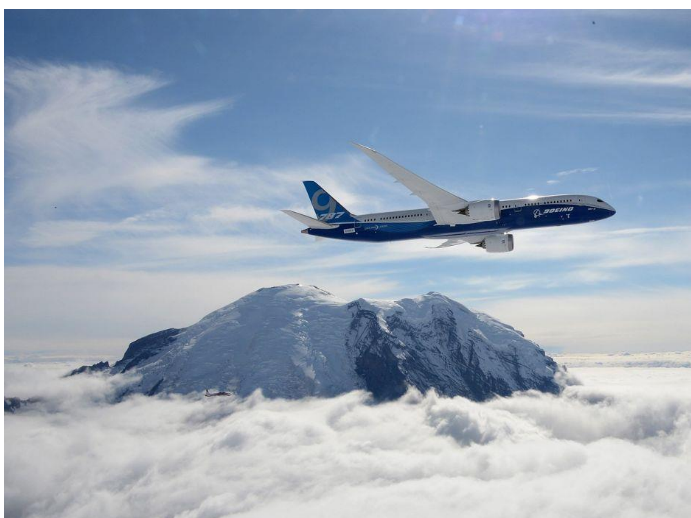
Boeing 787 Dreamliner