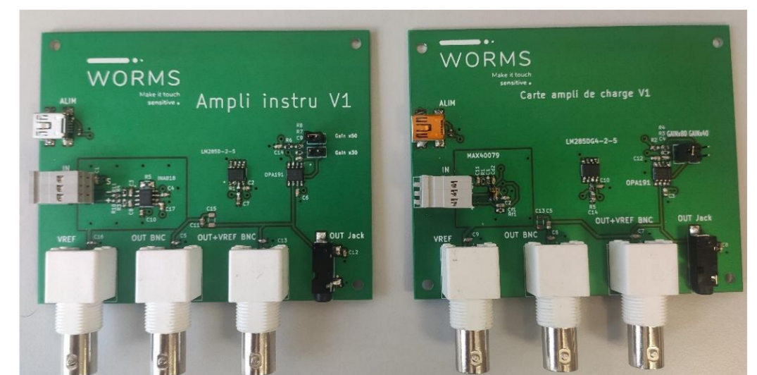
Pré amplificateur d'instrumentation et de charge

MOTS-CLÉS : Vibration, Piézoélectricité, électronique analogique, conditionnement, pré amplificateur.