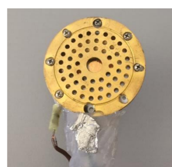
Capteur WORMS avec son emballage (ESIMICS 2)

À la fin du projet, nous avons développé deux cartes de pré amplification avec chacune d'elles un conditionnement particulier. Ces cartes permettent d'amplifier le signal venant du capteur en restant le plus neutre possible pour pouvoir ensuite l'enregistrer via une central d'acquisition.